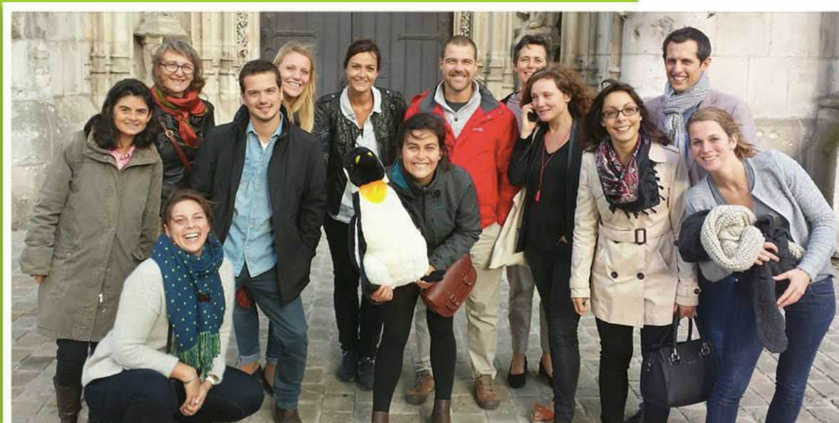
Les Déraisonnables 2015